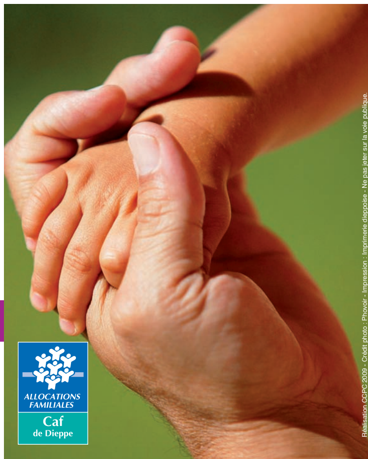
Réalisation: CCFPC 2009 - Impression: Imprimerie dieppoise - Ne pas jeter sur la voie publique.